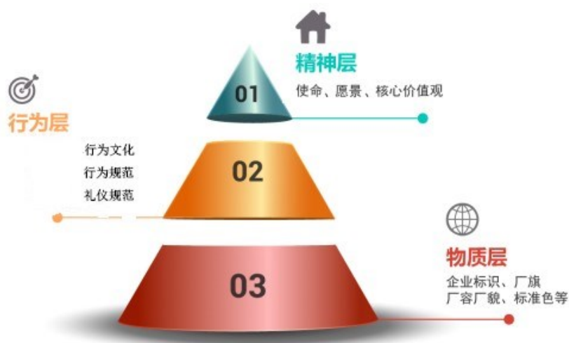
图表 4.1-1 公司企业文化体系

随着公司的发展壮大，人员和业务规模都有了较大的增加，管理难度也逐渐加大。为确保企业健康发展，公司系统构建了企业文化体系（见图表 4.1-1），以使命、愿景和核心价值观为统领，形成一套完整的管理理念（见图表 4.1-2）。引领全体员工不断学习，不断追求卓越。